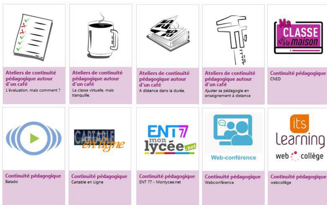
Les outils numériques à privilégier

Nous sommes bien conscients de votre engagement au service des élèves, de l'investissement et de l'énergie déployés depuis le début de cette période de confinement. À ce titre, nous vous remercions et vous renouvelons notre confiance. Nous sommes à vos côtés pour vous accompagner, tout comme les missions académiques, les divisions du rectorat et des DSDEN.